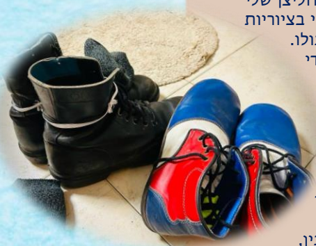
אוריה נשוי + 7, גר בחספין ומשמש כליצן רפואי וחינוכי

הליצן שבי יגיד לי שזה בסדר לא להבין, בסדר שלא יהיו תשובות ומותר להיות נבוכים אל מול המציאות, והחכמה היא להישיר אליה מבט אמיץ מלא באמונה בהנהגת ה' בעולם, ואולי אפילו להצליח לחייך ולהרים את האף.